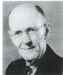
ロータリーの創始者 ポール・ハリス氏 (1868～1947)