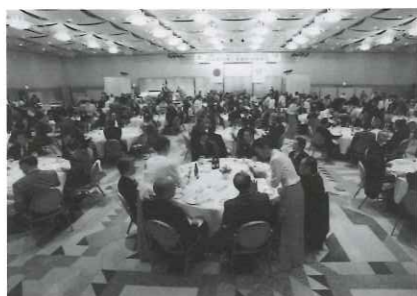
会員による相互交流会と親睦会