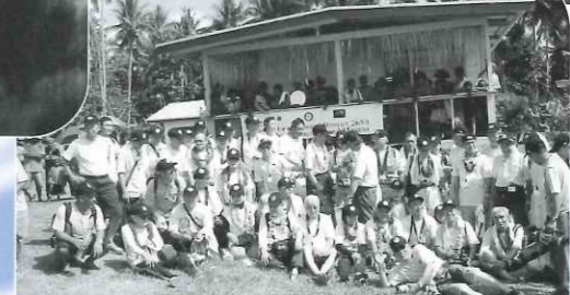
パプアニューギニアでの活動。 毎年、WHOと協力しポリオワクチンの接種活動。