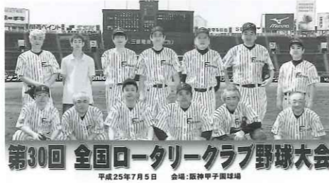
第30回 全国ロータリークラブ野球大会 平成25年7月5日 会場：阪神甲子園球場