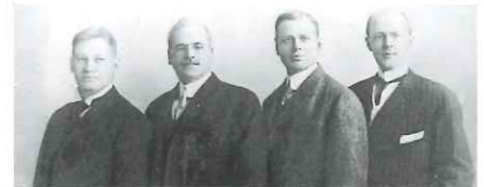
ロータリーを創設した ポール・ハリスと3人の仲間▶

このように、歴史的に見ても、ロータリーとは職業倫理を重んじる事業および専門職務に携わる人の集まりなのです。その組織が地球の隅々まで拡大するにつれて、ロータリーは世界に眼を開いて、幅広い奉仕活動が求められるようになり、現在は多方面にわたって多大な貢献をしています。