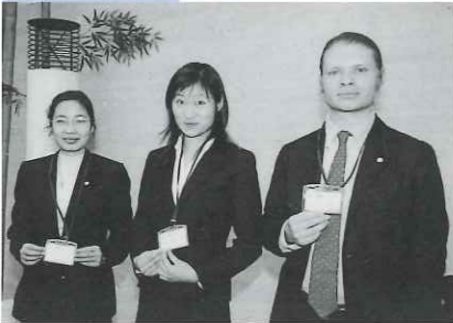
日本で学ぶ外国人留学生の支援