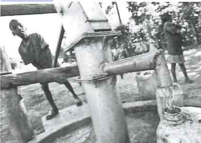
井戸を掘り、綺麗な飲み水を確保