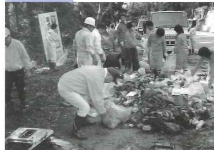
不法投棄物撤去作業など、環境を守る