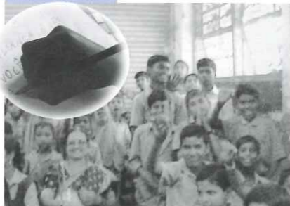
子どもたちに明るい未来を贈る