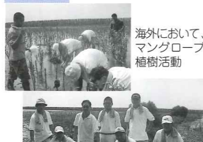
海外において、 マングローブ 植樹活動