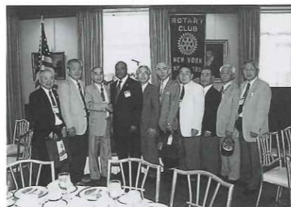
海外クラブとの交流 （ニューヨークロータリーでの例会参加）