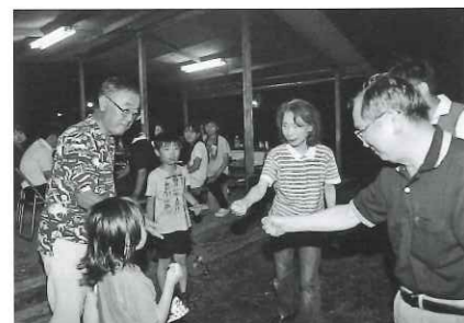
家族をまじえて、家族例会