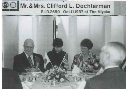
財団奨学生と留学生活の支援