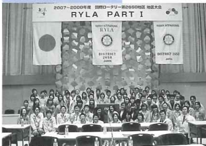
若者と思い切り話そう