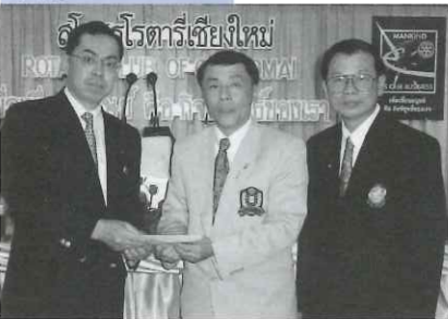
友好クラブ締結 (タイ・チェンマイRC)