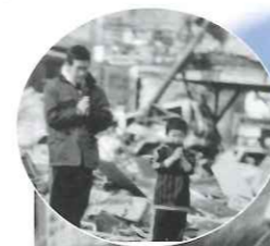
東日本大震災復興への支援活動