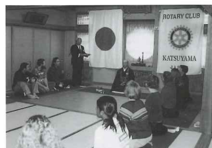
青少年交換（研修生の座禅体験）