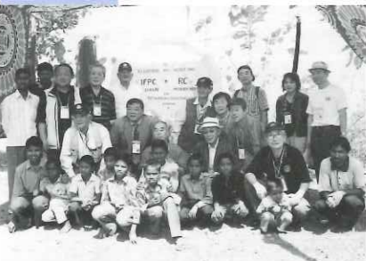
水資源確保の海外支援