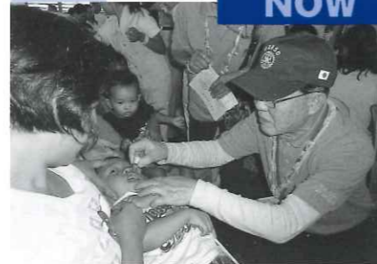
ポリオ撲滅に挑む