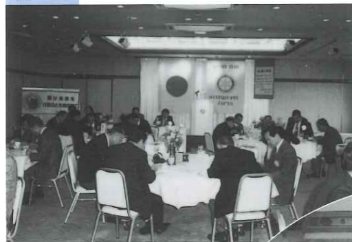
年度始めの計画を 検討する協議会