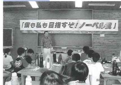
青少年のためのさまざまな支援