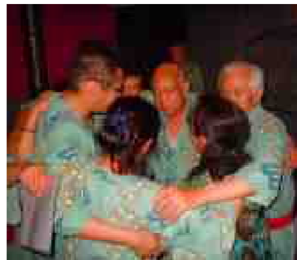
次年度宜しく 何のスクラムでしょうか・・・!?