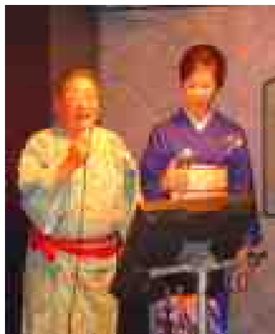
江成会長、お疲れ様でした！