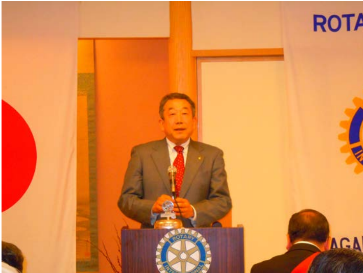
最任次年度幹事による乾杯