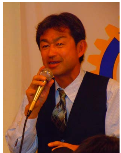
懇親会司会 金沢会員