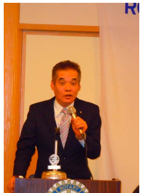
閉会の挨拶 豊岡会長エレクト