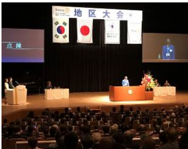
<杉岡ガバナーご挨拶>