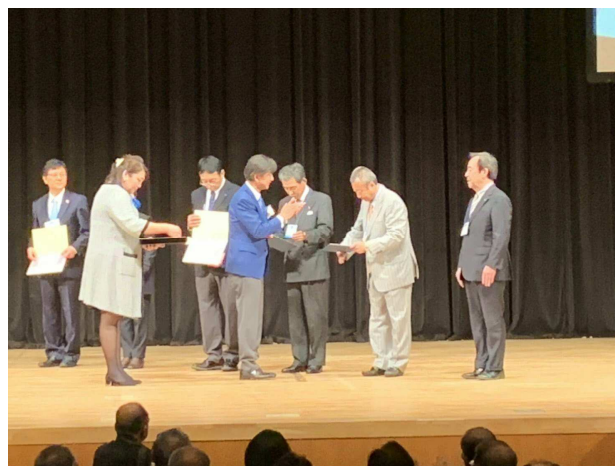
<各種表彰式の模様>