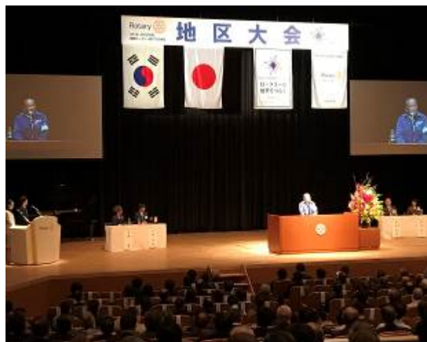
<本村相模原市長ご挨拶>