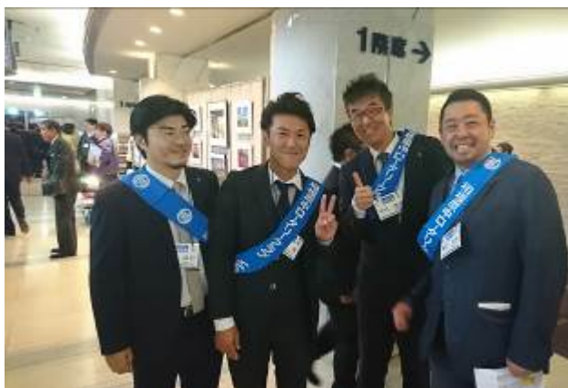
<地区大会お手伝いの会員皆さん>