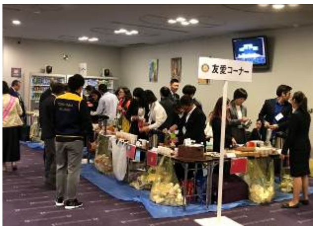
<米山奨学生・学友によるお茶のサービス>