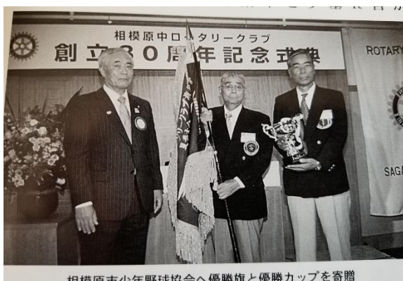
相模原市少年野球協会へ優勝旗と優勝カップを寄贈

創立 30 周年記念事業として、相模原市少年野球協会に優勝旗、優勝杯、横断幕を寄贈