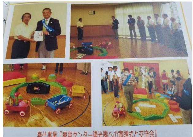
奉仕事業『療育センター陽光園への寄贈式と交流会』