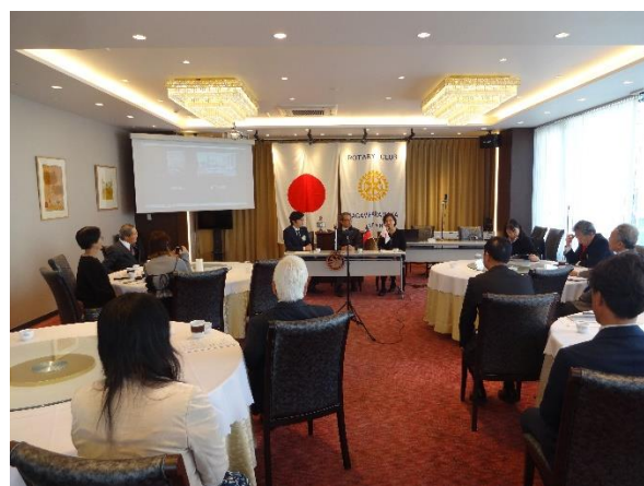
【 例 会 風 景 】