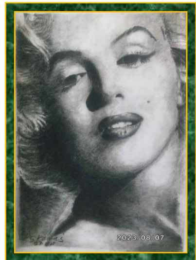
「マリリンモンロー」