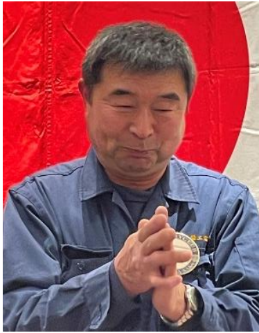
締め挨拶 大井会長エレクト