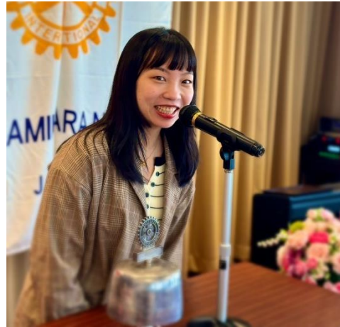
クラブより奨学金贈呈